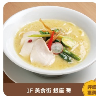
1F 美食街 銀座 簞