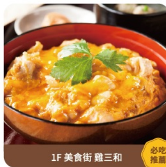
1F 美食街 雞三和

Numerous famous catering brands in Japan have come to Taiwan. A wide range of diverse dining choices allows you to feast on and glut yourself with delicacies in addition to shopping.