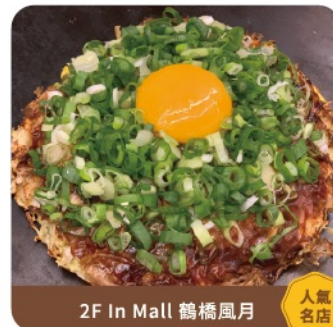
2F In Mall 鶴橋風月