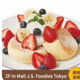
2F In Mall J.S. Foodies Tokyo